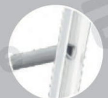
Peldaños en forma "D" antideslizantes