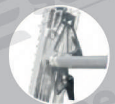
Ganchos traba peldaños