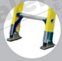
Zapatas ajustables con jebe antideslizantes