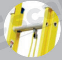
Sistema de elevación de polea y cuerda