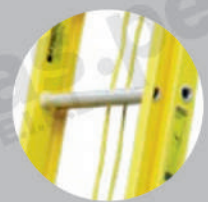
Peldaños antideslizantes tipo "D"