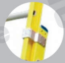
Guías de deslizamientos